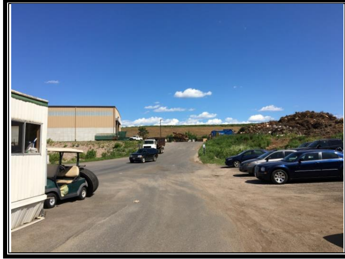
موقف محطة التحويل. منطقة تفريغ النفايات هي في أعلى التل