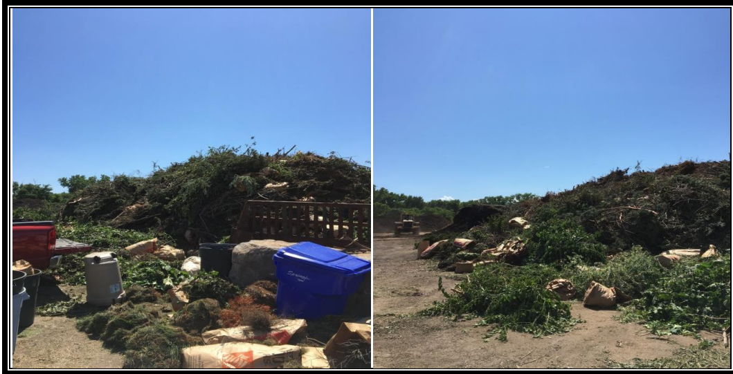
منطقة التخلص من نفايات الحديقة