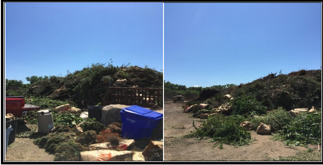
यार्ड फोहोर व्यवस्थापन क्षेत्र